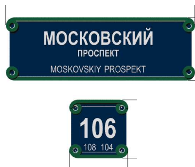
пример для района современной застройки

Основные требования к содержанию знаков адресации включают в себя: