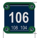
номерные знаки, обозначающие номера домов