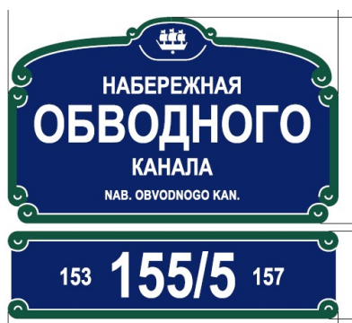
пример для исторической застройки

Внешний вид знаков адресации может отличаться в зависимости от места расположения объекта, ниже приведены примеры знаков адресации, размещенных в исторической части города и спальных районах города: